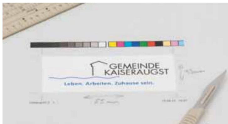
Die neu entwickelte Kombination aus Logo und Claim

Zukünftig wird das Logo unserer Gemeinde von einem Leitsatz begleitet, der es inhaltlich stützt und die besonderen Eigenschaften von Kaiseraugst hervorhebt. Logo und Claim werden als Einheit ab April 2010 in allen Druckerzeugnissen und auf unserer Website gemeinsam erscheinen. Ein eigens dafür geschaffenes Handbuch und diverse Vorlagen und Anwendungsbeispiele ermöglichen den Mitarbeitern der Gemeindeverwaltung in Zukunft, dass das Erscheinungsbild von Kaiseraugst immer nach den gleichen Vorgaben angewendet werden wird.