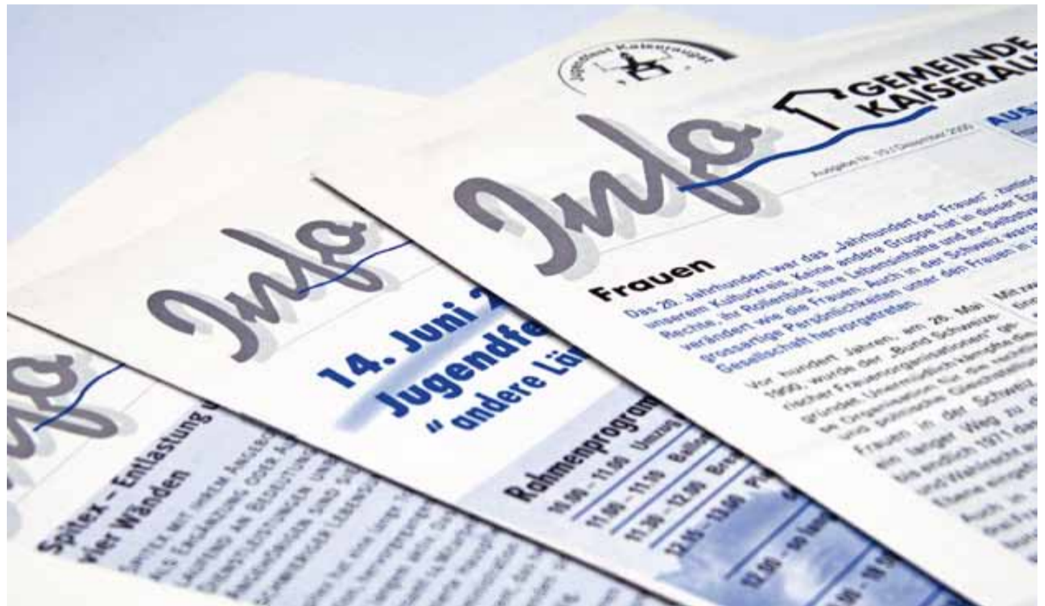
Das bisherige Infoblatt