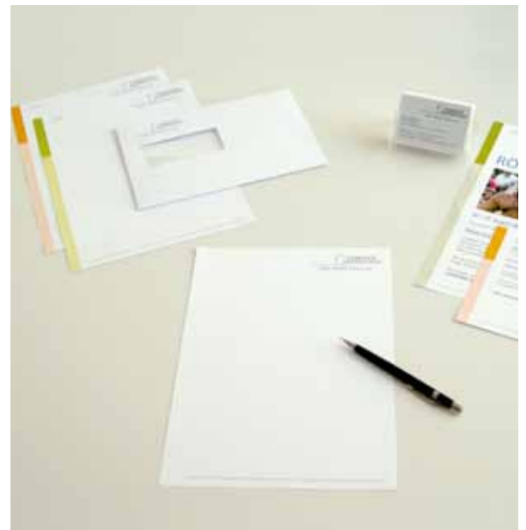
Die neuen Briefschaften von Kaiseraugst

Denn mit Ihrem Engagement in Vereinen und Gruppen, Ihrem Interesse am Aufbau, am Erhalt und am achtsamen Umgang mit öffentlichen Einrichtungen sowie an einem guten Verhältnis zu Nachbarn und Mitbürgern tragen Sie ganz entscheidend dazu bei, dass wir uns als eine Gemeinschaft empfinden können, in der man ganz im Sinne unseres Leitsatzes nicht nur lebt und arbeitet, sondern sich zuhause fühlt.