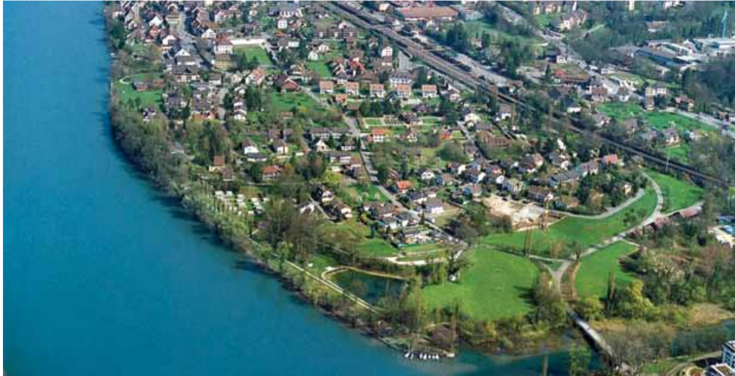
Unsere Gemeinde aus der Vogelperspektive